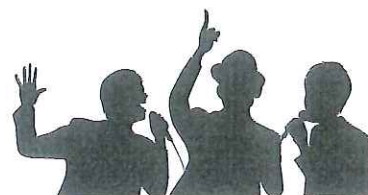
大学生アカペラグループ