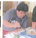
社会福祉法人 産経新聞厚生文化事業団 豊能町立たんぼの家 など